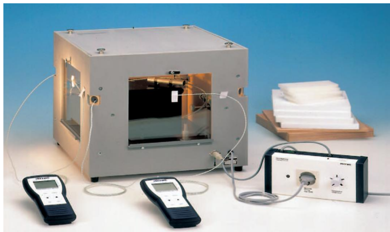
Obrázok 1 Tepelne izolovaná komora s vymeniteľnými stenami

Ako meracia aparatúra bude na experiment použitá nenormovaná testovacia metóda pomocou tepelne izolovanej komory (High insulation box) s vymeniteľnými stenami (Obr.1). Zariadenie sa skladá z tepelne izolovanej komory, termostaticky regulovaného vyhrievania vnútorného objemu, vymeniteľných bočných stien, žiarovky ako zdroja tepla na vyhrievanie vnútorného priestoru a dataloga s termočlánkami na meranie teploty.