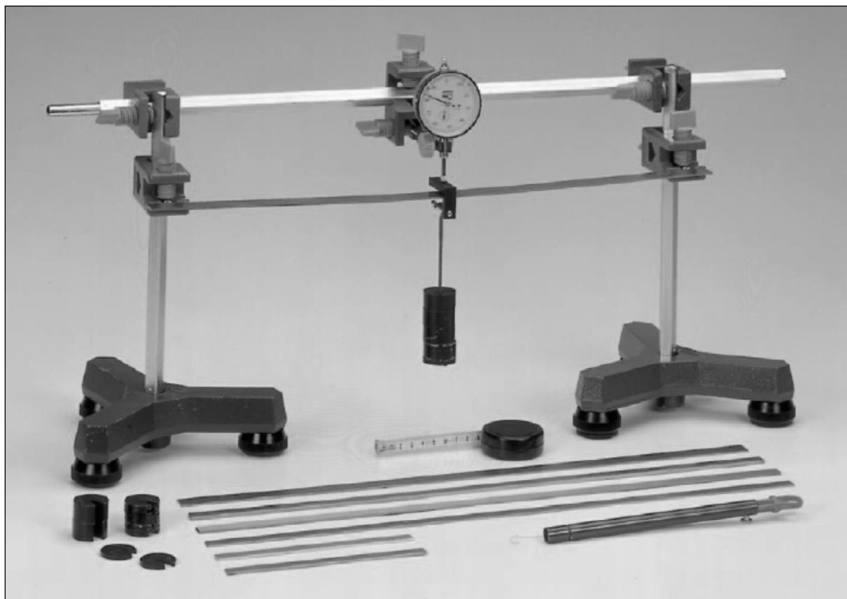
Obr. 4.1 Usporiadanie experimentálnej zostavy pre určenie modulu pružnosti

2 vzorky smreku v tvare plochých tyčí rôzneho obsahu plošného prierezu, odchýlkomer KINEX, závažia, podstavce, meter.